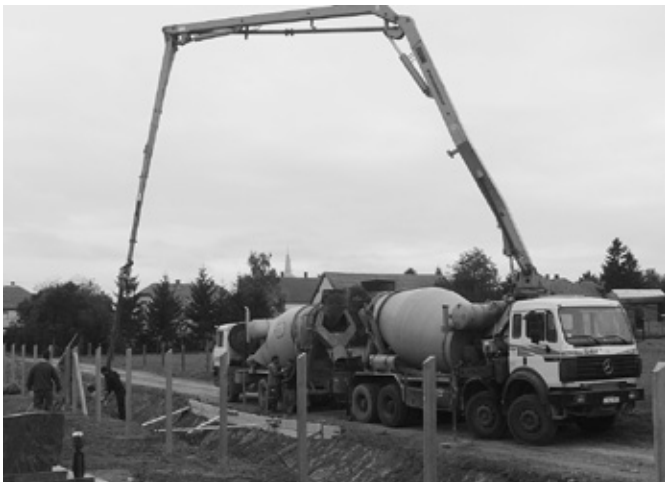
Zajlik a temetőkerítés építése

vételt is jelenthet számunkra! Erre a kölcsönösen előnyös üzleti tranzakcióra alapozva újtottuk fel a művelődési házat, cseréltünk nyílászárókat, hőszigeteltünk, burkoltunk, festettünk. A fenti összegeket a bank öt évig akkor is köteles teljesíteni, ha az üzletmenete nem a legkiválóbb. Nyilván, ha a bank megtalálja számítását, akkor ez egy hosszú távú, biztos bevételi forrásunk lehet évtizedekre kódolva, amely bevételből ugyancsak lakóhelyünk fog szépülni. Ezért is kérek mindenkit, akinek módjában áll nyisson itthon, hozza át máshol lévő folyószámláját, intézze idehaza betét- és hitelügyeit, mert ezzel is Náráit támogatja, hozzájárul lakóhelyének fejlesztéséhez. A bank többek között Szombathelyen is rendelkezik fiókkal a Thököly utcában, ott is intézhetjük banki teendőinket, de fontos, hogy a számlanyitást, az első papírügyek intézését itt Náráiban kezdeményezzük, mert csak ekkor számít bele a bank helyi belső elszámolásába. Múltkori újságunkban megjelent állásajánlatokra úgy tudom, hogy több mint tíz pályázat érkezett, akik közül a bank Hoós