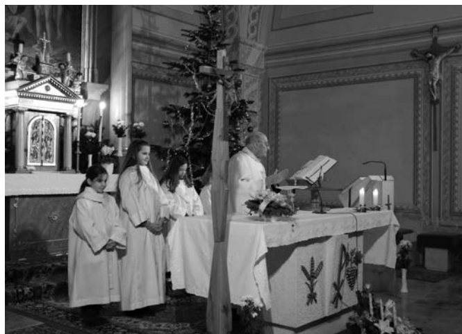
Sokan vettek részt az éjjeli szentmisén

Fészek a szíved – gondolja, aki igazán szeret. „Benned szeretnék lakni ott, hol dolgoz, szorgalmas szíved. Egy szívet szeretnék veled! (Illyés Gyula i. m.).