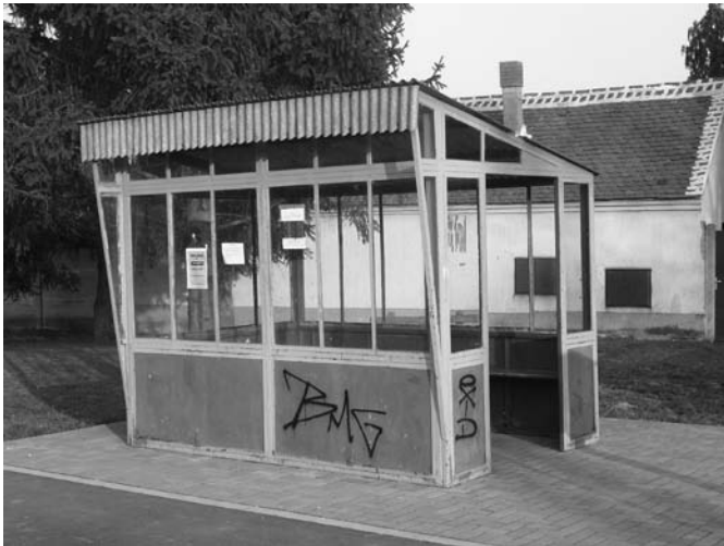
Ilyen volt a buszváró

A mezőgazdaszokat leginkább foglalkoztató kérdés a külterületi utak rossz állapota. Ördögi kör ez: az utak tulajdonjoga ugyan az önkormányzaté, fenntartására címzett forrást erre senki nem biztosít számunkra. És bár az utakat nem az önkormányzat teszi tönkre, a mezőgazdászok szívesen vennék ennek kijavítását. Dr.