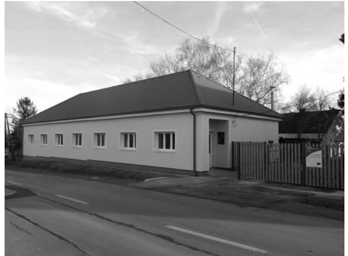
és ilyen lett a Sargaliliom Alkotó és Községi Ház

ron megyei Lébény és a Vas megyei Nárai pályázatát tartották támogatásra alkalmasnak. A többiekét vagy elutasították, vagy tartaléklísta helyezették. Összefoglalva, elképzeléseim, elképzeléseink valóra váltak: nem egészen fél év alatt (2011 őszétől – 2012 tavaszáig) 40 millió forintos fejlesztést valósíthatunk meg java részben uniós támogatással, a falunak ezen szegletén. Alkotóház kialakítása: 22 millió forint, megújuló energia ellátó rendszer kiépítése: 16 millió forint, óvoda belső felújítása, kerítés átépítése: közel 2 millió forint. Természetesen a mintegy 40 millió forintos jórésztben Európai Unió támogatással megvalósuló fejlesztést követően a munkák teljes körű befejezése után kora nyáron méltó módon, színvonalas átadási ünnepségre várjuk a falu összes