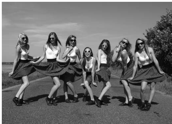
Lányok a Náraai határban